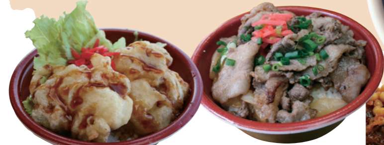
いのし焼肉丼/奥津軽いのし牧場(今別町) ほたて天丼/ラウンジ・センチュリー(青森市)